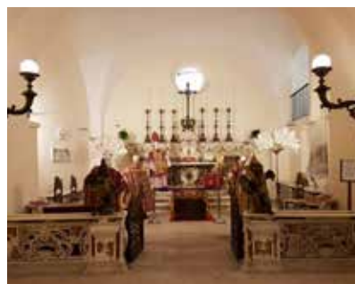
La Cripta nel Museo Ecclesiastico Diocesano.

delle sale a nord del chiostro intorno al quale il museo si sviluppa, eseguiti nel 1965. Presumibilmente era la antica chiesa della Confraternita della Annunziata e fu utilizzata negli anni dal 1605 al 1722, prima della realizzazione da parte di mons. Cavalieri della chiesa di San Benedetto, come recita l'epigrafe dedicatoria posta sulla porta di accesso: «Al Padre San Benedetto. Entrerai pieno di riverenza e di rispetto in questa chiesa da oltre un secolo vivamente desiderata a cavallo dell'ultimo anno del pontificato di Papa Clemente XI ed il primo del Pontificato di Papa Innocenzo XIII questa lapide le pie monache sue figlie [di San Benedetto] a proprie spese posero e dedicarono 1722».