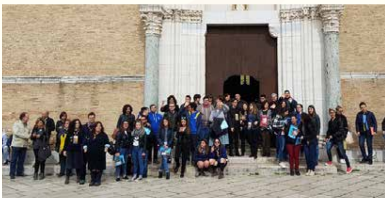
I giovani sinodali in posa davanti la Cattedrale.