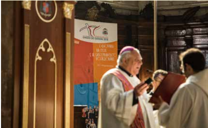
Lucera, Basilica Cattedrale, 14 aprile 2018. La celebrazione d'apertura dei lavori sinodali.