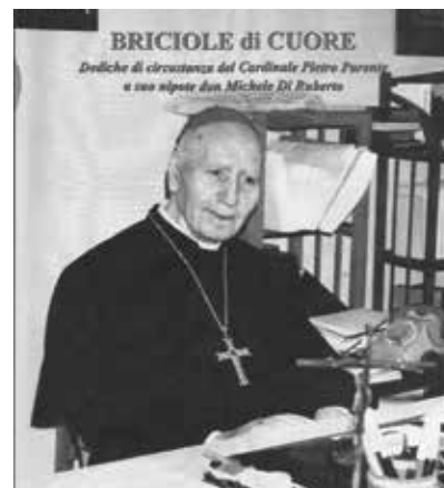
La copertina del libro.

Nella prima parte della pubblicazione è illustrata la biografia del Porporato casalnovesi, con le tappe fondamentali del suo percorso ecclesiastico e pastorale: l'insegnamento di teologia dommatica nelle Pontificie Università Lateranense e Urbaniana dal 1926 al 1955; la nomina nello stesso anno ad Arcivescovo di Perugia da parte del Papa Pio XII; l'incarico nel 1959 da parte di Papa Giovanni XXIII ad Assessore della Suprema Sacra Congrega-