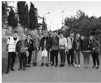
Castelluccio Valmaggiore, 25 aprile 2018. Il gruppo dei pellegrini che hanno percorso 52 km a piedi.

52 km a piedi non hanno fiaccato la fede dei devoti pellegrini di Ca-