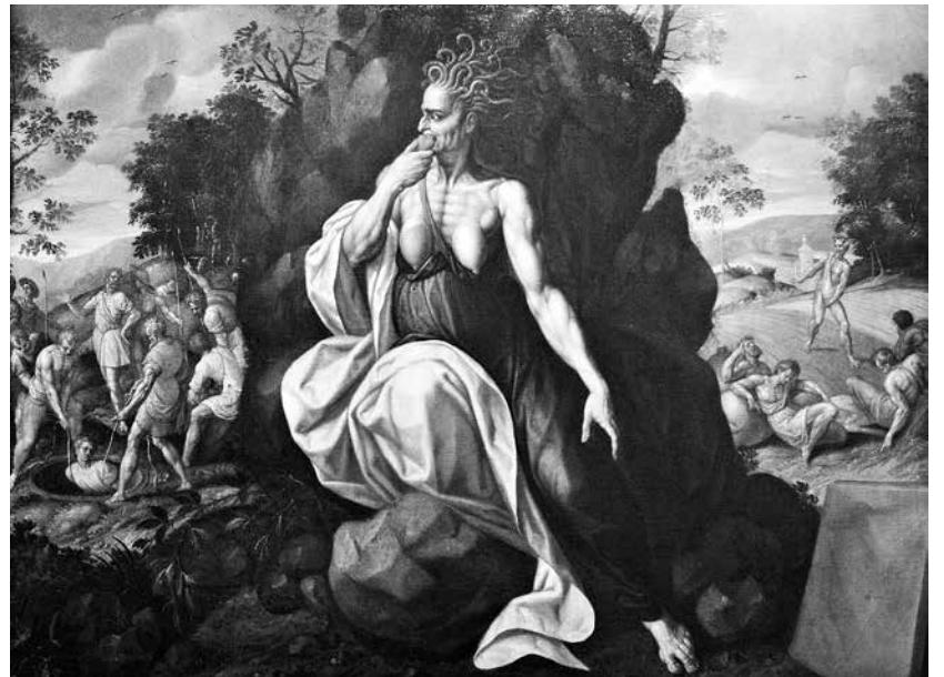
Museo Nazionale di Capodimonte a Napoli, Jacques de Backer, Invidia .

Una storiella: «Un giorno Dio disse a un uomo invidioso che gli avrebbe concesso qualunque cosa avrebbe chiesto, preavvisandolo che ne avrebbe tuttavia concesso