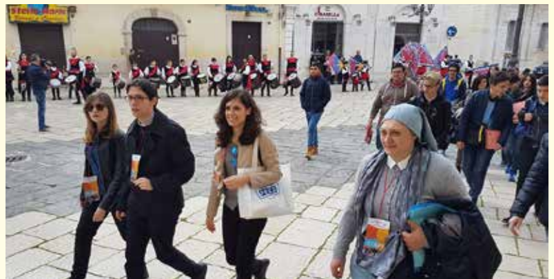
Lucera, Piazza Duomo, 14 aprile 2018. L’inizio dell’assemblea plenaria.