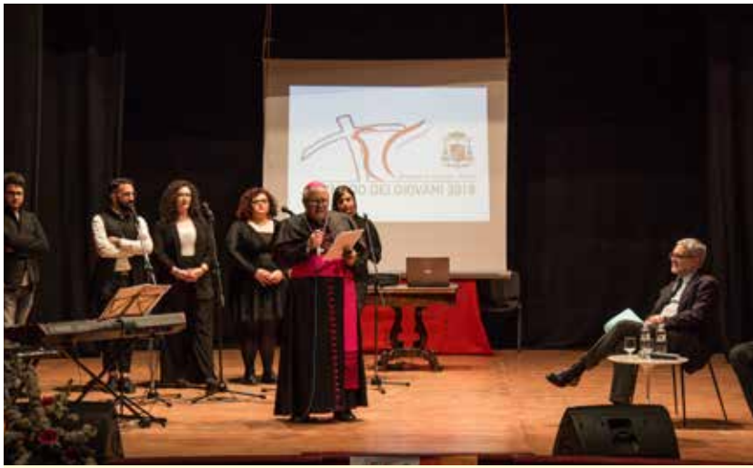
Lucera, Teatro Garibaldi, 13 aprile 2018. L'inaugurazione del Sinodo.