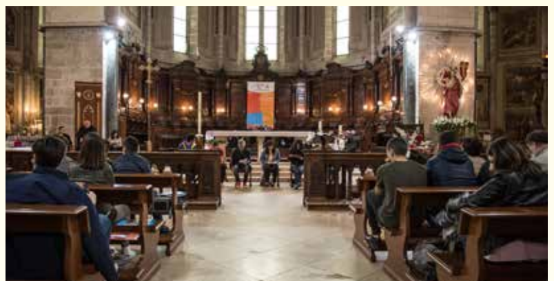
Lucera, Basilica Cattedrale, 14 aprile 2018. Assemblea plenaria.