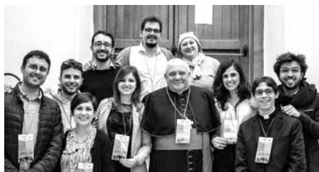
Il coordinamento del Sinodo diocesano.

Tre giorni di riflessione, condivisione e movimento. Così si può riassumere il Sinodo diocesano dei giovani "I giovani, la fede e il discernimento vocazionale" che si è svolto a Lucera nei giorni 13-14-15 aprile. Una vera full immersion che ha visto come protagonisti i giovani, credenti e non, del nostro territorio che si sono messi in discussione e all'ascolto dell'altro.