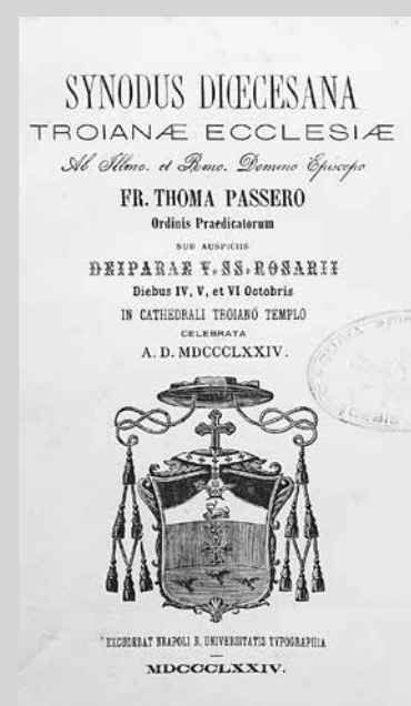
Frontespizio del Sinodo diocesano di mons. Tommaso Passero (Troia, 1874).

epigrafe marmorea, purtroppo mutila, affissa nel corridoio dell'episcopio; il secondo, nel 1620, celebrato da Fabrizio Suardo, con il pastorale del quale prendono possesso della sede i vescovi della diocesi di Lucera-Troia; il terzo, nel 1694, dal foggiano Domenico Morelli, l'autore del Theorico-praxis civilis, criminalis, canonica ex observationibus in Genuensis praxim eruta .