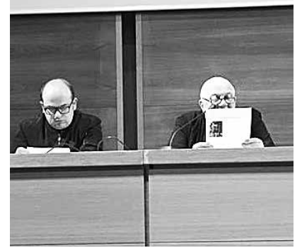
San Giovanni Rotondo, 21 aprile 2018. L'incontro dei gruppi di preghiera

Si è svolto nel pomeriggio di sabato 21 aprile in San Giovanni Rotondo, il raduno di tutti i "Gruppi di preghiera di Padre Pio" della diocesi di Lucera-Troia.