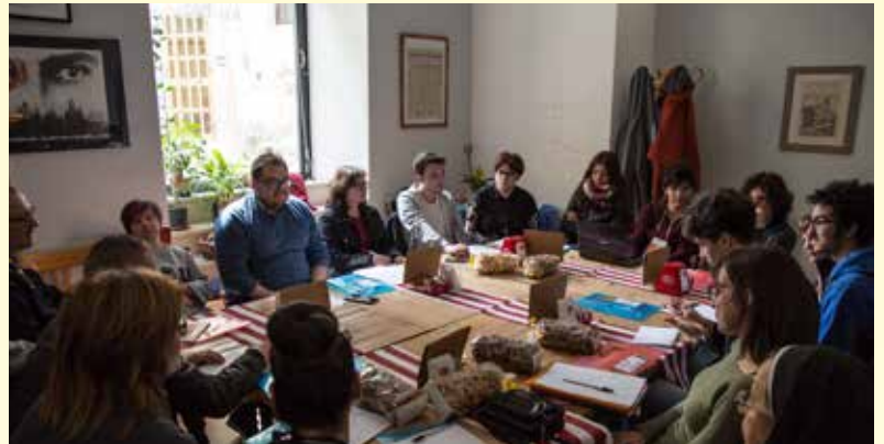
Lucera, 14 aprile 2018. Uno dei sei gruppi laboratoriali.