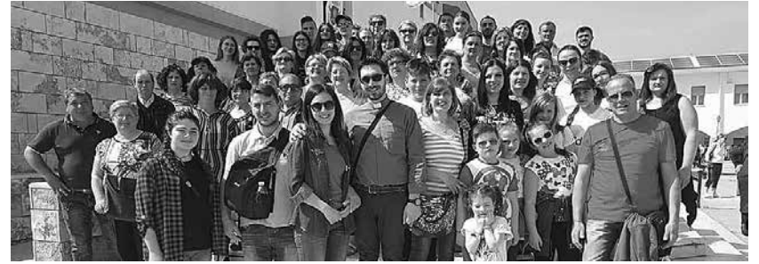
Santuario dell'Incoronata (Foggia), 27 aprile 2018. I pellegrini di Celle di San Vito e Faeto.

L'esperienza spirituale della sfilata dei carri si è poi ripetuta nel fine settimana nei rispettivi paesi dauni, con il rientro dei carri e la celebrazione della santa Messa.