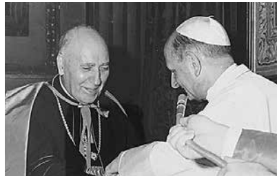
Il card. Pietro Parente in un incontro con papa Paolo VI.

Qualche tempo prima della chiusura della terza sessione del Vaticano II (1964), papa Montini interpellò mons. Parente, da lui ritenuto "teologo di chiara fama", circa la giustificazione del titolo