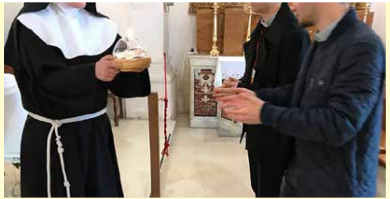
Biccari, Monastero delle clarisse, 14 aprile 2018. La consegna della lampada sinodale.

A chiudere la giornata, la celebrazione battesimale e un concerto live a cura dei gruppi locali, mentre domenica 15 aprile, la restituzione dei lavori sinodali nelle singole parrocchie della diocesi.