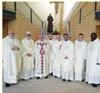
San Giovanni Rotondo, Basilica di San Pio, 11 maggio 2019. I concelebranti.

Il nostro Vescovo ha spesso sottolineato l'esigenza di non abbandonare la nostra anima alla tristezza, di non abbandonare