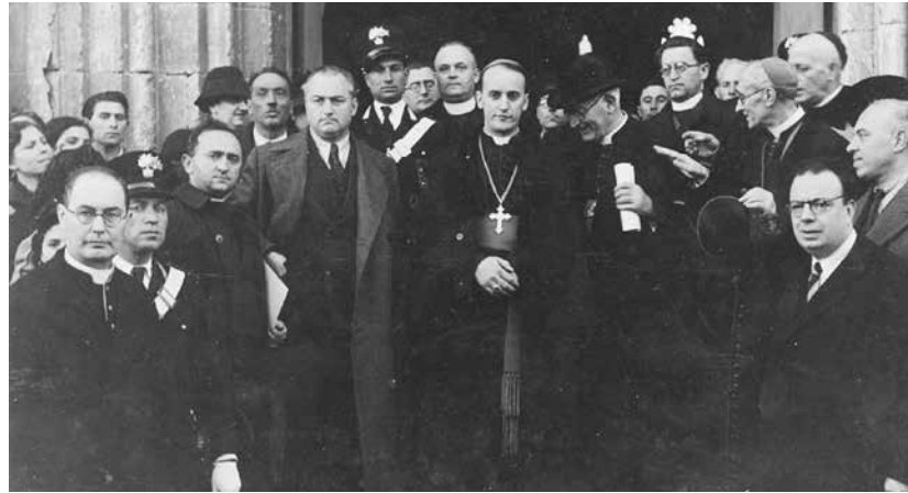
Lucera, Cattedrale, 17 novembre 1939. Visita dell'arcivescovo Stepinac.

Stepinac, oggi beato, da arcivescovo di Zagabria, visitò, accolto dal vescovo Giuseppe Di Girolamo, la città di Lucera il 17 novembre 1939. Lo accompagnarono il vescovo di Spalato e Traù, Quirino Bonafacic, trenta sacerdoti e cinquanta fedeli. La sua visita alla cattedrale lucerina si deve al legame che intercorre tra Zagabria e Lucera, identificabile nella figura del beato Agostino Kazotic. Il gruppo di pellegrini croati, salutati da un gran numero di lucerini e dalle autorità locali, partecipò alla messa nella cattedrale, visitò il sepolcro del beato Agostino, e prese visione delle altre reliquie del Beato conservate nella basilica. Visitarono l'episcopio, il municipio dove ricevettero il saluto del podestà, il museo civico, la chiesa e il convento di san Domenico, san Bartolomeo, san Francesco ed il castello. Per l'occasione, mons. Di Girolamo donò a Stepinac delle reliquie del beato Agostino, alcune copie del fascicolo pubblicato per il Congresso Eucaristico del 1937 ed il proprio liturgico della diocesi per la festa del Beato. La vicenda del card. Stepinac si intreccia con quella del governo croato degli ūstascia, da questi in un primo tempo appoggiato, poi criticato pubblicamente per l'eccessiva violenza e per le leggi razziali. La presa di posizione dell'arcivescovo comportò l'arresto di una trentina di sacerdoti. L'avvento del comunismo complicò ulteriormente