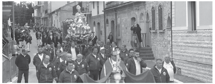
Pietramontecorvino, 19 maggio 2019. Il pellegrinaggio in onore di sant'Alberto.

La memoria storica che si tramanda da anni e la profonda devozione sono un mix efficace che eccezionalmente e incredibil-