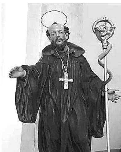
Faeto, Parrocchia SS. Salvatore. La statua di san Domenico.