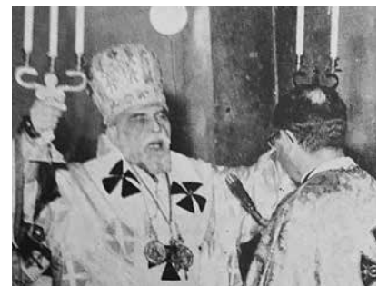
Alcuni momenti della visita.

daunia il card. Josyp Slipyj, arcivescovo di Leopoli degli Ucraini. Accolto dalle autorità dal clero e dal popolo, si diresse in cattedrale salutato da mons. Piroto e presiedette la divina liturgia "nei fastosi abiti pontificali con la preziosa tiara gemmata, lento e solenne scandisce le preci i canti e i gesti liturgici, che la Schola Cantorum del Seminario Ucraino di Roma accompagna e commenta con le cadenze di patetiche melodie orientali". "Non è sfuggito il particolare gesto del Celebrante, che al momento della benedizione finale, ha fatto porgere da un suo ministro la Croce al Vescovo diocesano, perché con la medesima benedicesse a sua volta il popolo presente". Nel 1939, Slipyj fu nominato arcivescovo coadiutore di Leopoli degli Ucraini, per diventare arcieparca metropolitano nel 1944 e capo della chiesa greco-cattolica ucraina. L'anno seguente, tornate al potere le truppe sovietiche, Slipyj fu arrestato insieme ad altri vescovi con l'accusa di collaborazionismo con il regime nazista. Fu processato dal tribunale sovietico e condannato ad otto anni di lavori forzati in un gulag della Siberia. Poi ancora ad altri cinque anni nel 1953, ad altri quattro nel 1958, fino a giungere alla deportazione a vita in Mordovia. Riottenne la libertà nel 1963 per l'intervento di Giovanni XXIII e di John Kennedy e si stabilì a Roma, in Vaticano, dove Paolo VI lo nominò arcivescovo maggiore e, nel febbraio del 1965, fu creato cardinale.