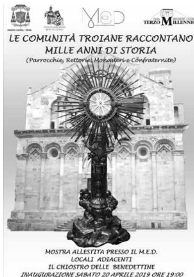
La locandina dell'evento e l'ostensorio custodito nel MED.

Ancora, sono esposti gli abiti della congrega del Santissimo, istituita nel 1519 (ricorre quindi quest'anno il 500°) dal Vescovo G. Pandolfini col titolo di "Confraternita del Corpo di Cristo" perché provvedesse al culto del Santissimo Sacramento nella Cattedrale di Troia, delle solennità del giovedì e del venerdì santo e della festa del Corpus Domini. Quelli della congrega dell'Annunziata e di San Leonardo, e quelli della Addolorata. Non manca l'ultima associazione, il gruppo "Santi Patroni", nato per dar seguito alla fondazione