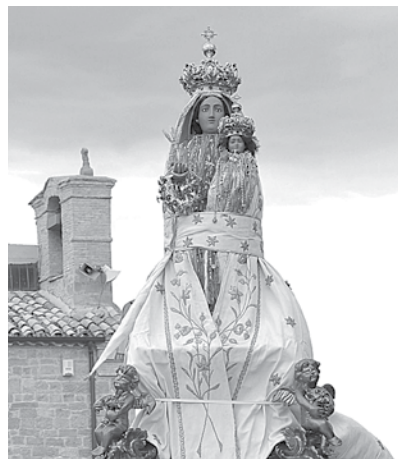
Volturino. L'effigie della Madonna della Serritella.

Domenica, i festeggiamenti sono entrati nel vivo con lo sparo dei mortaretti, la celebrazione della messa e la processione del simulacro della Vergine dall'antico borgo di Serritella alla Chiesa Badiale di Volturino, accompagnata dalla banda musicale "Città di Gambatesa". In questa occasione, si è soliti addobbare carri in onore della Madonna, che rappresentano momenti particolari della vita di Gesù, dalla nascita alla predicazione, passando per riproduzioni della Madonna della Serritella e a semplici composizioni floreali. A rendere uniche