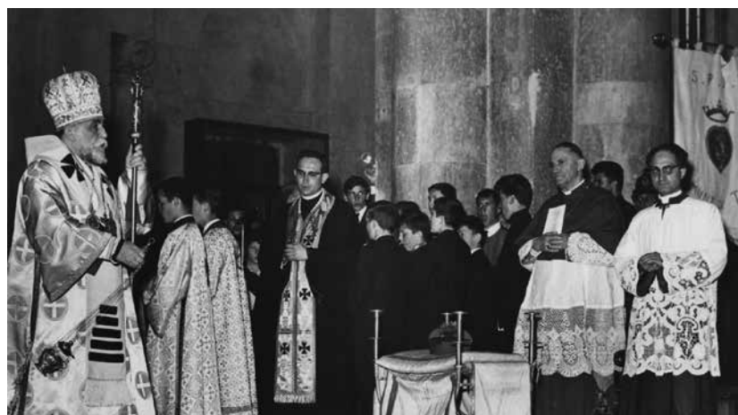
Troia, Basilica Cattedrale, 9 maggio 1965. Il card. Slipyj in occasione del Congresso Eucaristico.

i rapporti tra stato e chiesa in Croazia. Infatti, nel 1946, la magistratura di Zagabria, dopo una laboriosa falsificazione di carte e documentazione fotografica, accusò Stepinac di collaborazionismo con il regime degli ūstascia e di attività eversiva contro lo stato jugoslavo, disponendone l'arresto. L'11 ottobre dello stesso anno fu condannato a sedici anni di lavori forzati, alla privazione dei diritti politici e civili per un tempo di cinque anni. I capi del governo chiesero ufficialmente