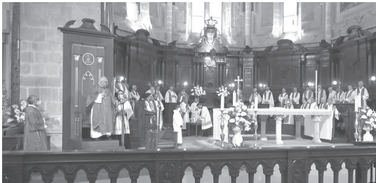
Lucera, Basilica Cattedrale, 4 giugno 2022. La Celebrazione Eucaristica diocesana nei primi Vesperi della solennità di Pentecoste.

Un evento "cattolico" dunque un evento missionario, perché la Chiesa diventa sempre più se stessa nella misura in cui annuncia con le parole e partecipa con la vita il Vangelo che la convoca ogni giorno e la grazia divina che ogni giorno la unisce e la rafforza. In questo dinamismo ecclesiale un compito particolare spetta ai presbiteri, necessari e principali collaboratori del Vescovo e perciò della vicenda ecclesiale. L'occasione sinodale è dunque propizia, per i sacerdoti, di crescere nel loro ruolo di operatori del vescovo, di vicinanza nel/al popolo santo, di educatori nella fede dei cristiani a cominciare da se stessi. I presbiteri sono, in un certo senso, dei "mediatori indispensabili" nella maturazione sinodale di partecipazione di tutti alla vita concreta della Chiesa, partecipazione che si declina nell'appartenenza convinta e crescente