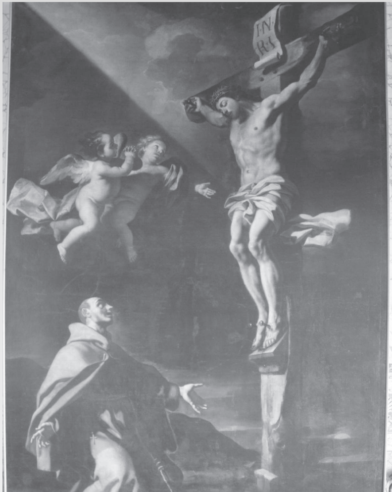
Troia, Episcopio. La Pala di Francesco Solimena.

Nell'opera, infatti, trovasi il primo riferimento al nome di Pietro d'Alcantara. Alla pagina 199 si legge: "Giunto in Troja nel gran Cappellone della Cattedrale erigè al Santo (San Pietro d'Alcantara) un magnifico Altare, in cui pose un assai grande bellissimo quadro del famoso pennello del Signor Francesco Solimena". Più avanti, il Rossi aggiunge: "A S. Pietro di Alcantara così gran Ri-