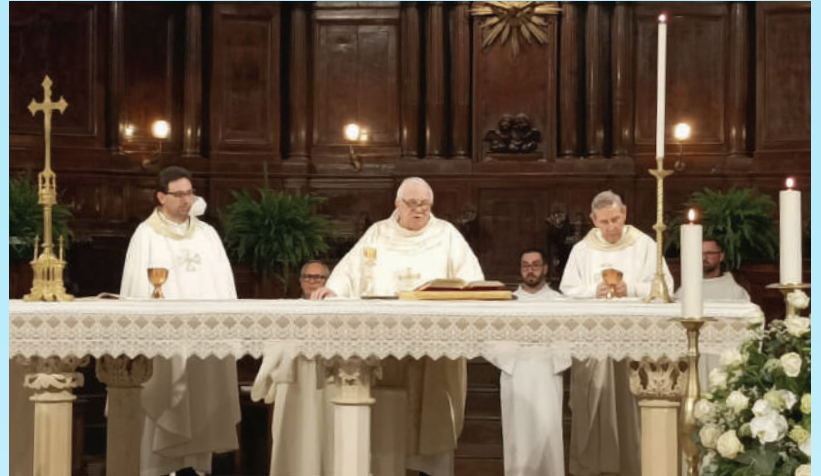
Lucera, Basilica Cattedrale, 18 giugno 2022. La celebrazione presieduta dal Vescovo con le famiglie della Diocesi.