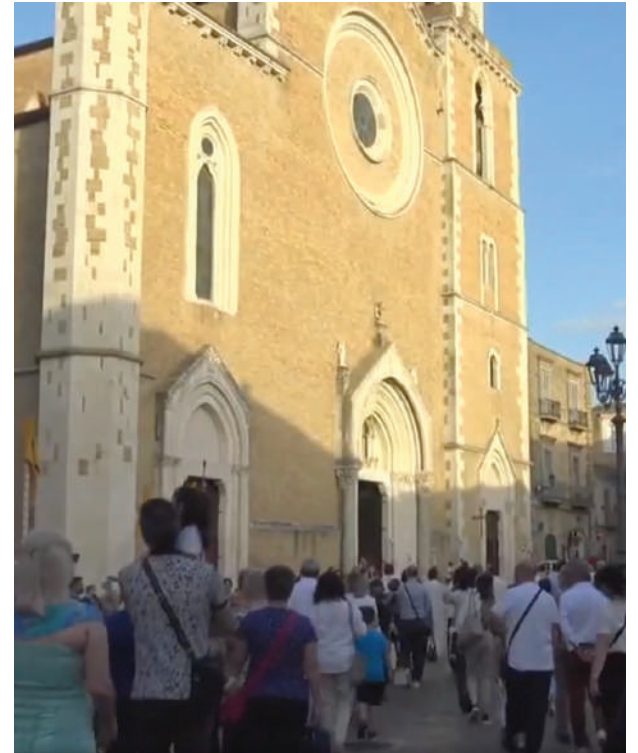
Lucera, 4 giugno 2022, Celebrazione vigilare di Pentecoste. La Chiesa di Lucera-Troia in cammino dalla Basilica-Santuario San Francesco alla Cattedrale.

“E insieme camminarono secondo lo Spirito Santo”: tratto dalla lettera di san Paolo apostolo ai Galati (cfr. Gal 5,16-26), è stato questo il titolo della Veglia diocesana di Pentecoste, celebrata sabato 4 giugno scorso a Lucera.