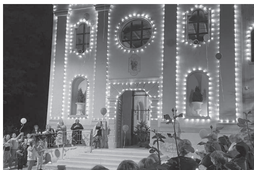
Volturara Appula, 1 giugno 2022. Torna la “Notte dei Santuari”.

Un evento a cui tutta la popolazione ha risposto con fede ed entusiasmo, vivendo in assoluto raccoglimento i momenti di preghiera. Anche i bambini hanno