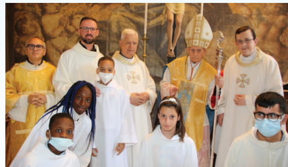
12 giugno 2022. Le celebrazioni col card. Simoni nel Monastero di Biccari (sx) e in Cattedrale a Lucera (dx).