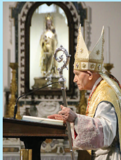
11 giugno 2022. L'accoglienza di Sua Eminenza a Casalvecchio di Puglia (sotto a sx) e la celebrazione in Concattedrale a Troia (sotto a dx).