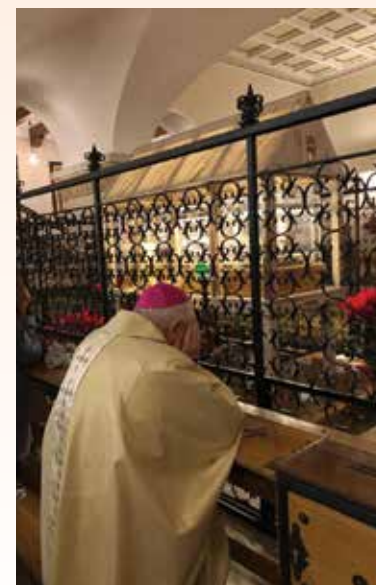
San Giovanni Rotondo, Cripta del Santuario “Santa Maria delle Grazie”, 14 gennaio 2023. Mons. Vescovo in preghiera.