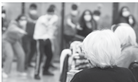
Troia, RSA "San Raffaele", 18 dicembre 2022. L'incontro dei giovanissimi con i degenti.

alcune ore in lieta armonia ma la pandemia e le connesse restrizioni purtroppo lo hanno recentemente impedito. A distanza di quasi tre anni quindi e con tutte le precauzioni del caso, è stato finalmente possibile regalare di nuovo agli ospiti della RSA questo momento con i giovani adolescenti della parrocchia. Adolescenti che già la scorsa estate avevano sperimentato un bagno di umanità al servizio dei più piccoli, in qualità di animatori dell'Oratorio Estivo. Infatti, sono stati proprio i canti e le danze del campo estivo che i giovanissimi hanno messo in scena, al cospetto degli ospiti, in un concerto di musica e sorrisi che ha scaldato il cuore dei degenti, operatori sanitari e degli stessi giovani. Al termine, gli stessi adolescenti hanno condiviso con gli ospiti