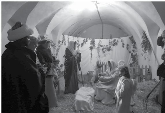
Pietramontecorvino, 6 gennaio 2023. L'arrivo dei Magi.

Essenziale, forte e sentita: a Pietramontecorvino la prima edizione del Presepe vivente ha lasciato tutti col fiato sospeso, confermandosi come momento di unione e solidarietà per tutto il popolo accorso. Nella suggestiva cornice del centro storico, dominato dall'imponente Torre Normanna, durante la santa Notte di Natale si è scelto di rappresentare la scena per eccellenza, la più importante, origine e fine del messaggio di