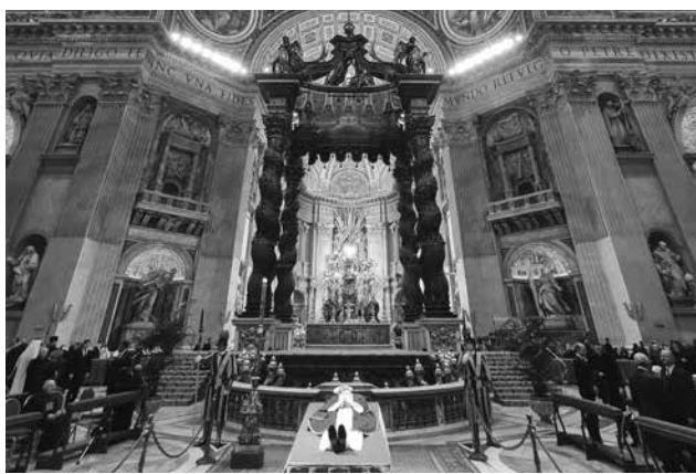
Vaticano, Basilica di San Pietro, 2-4 gennaio 2023. La salma di Benedetto XVI esposta.

Una sorta di «sintesi spirituale» degli scritti di Benedetto XVI: qui brilla la sua capacità di mostrare sempre nuova la profondità della fede cristiana. Ne basta un piccolo florilegio. «Dio è un evento di amore», espressione che da sola rende giustizia con pienezza di una teologia sempre armoniosa tra ragione e affetto. «Che cosa mai potrebbe salvarci se non l’amore?» ha chiesto ai giovani nella veglia di preghiera a Colonia, nel 2005, meditazione qui opportunamente