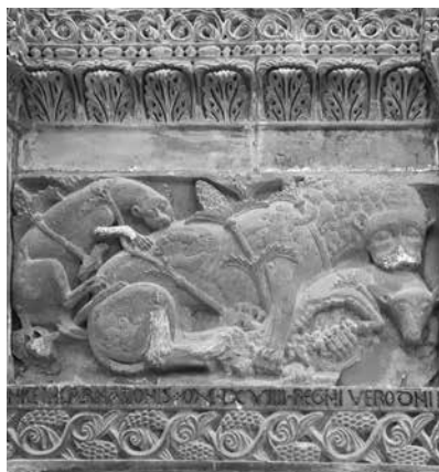
Il pulpito del 1169.

Se il significato dell'agnello è abbastanza chiaro, resta l'interrogativo: chi è il leone? chi è il piccolo cane bianco? Non mi è stato ancora possibile consultare al proposito nessuna opera di storia dell'arte; non so neppure da quali fonti l'amico che ho ricordato prima abbia tratto la sua interpretazione dell'immagine; sono perciò costretto a lasciare aperta la questione riguardante la correttezza dell'interpretazione storica. Dato che l'opera appartiene al periodo del dominio svevo, si potrebbe presumere che vi sia rappresenta-