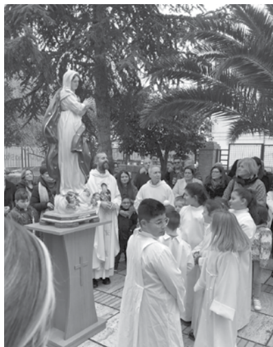
Lucera, Parrocchia "San Pio X", 8 dicembre 2022. Attorno all'Immacolata.

Per l'occasione, assai sentita è stata la scelta del parroco di celebrare la novena, di mattina, a ridosso del suono della prima campanella, dinanzi alla scuola elementare "Bozzini-Fasani" di Via Pasubio, assieme alle mamme che sono solite accompagnare i figli a scuola. L'iniziativa, che ha riscosso grande successo ed entusiasmo: "una semplice preghiera ci ha unite - ha dichiarato una partecipante -, lasciandoci fermare per un istante, dinanzi a una vita frenetica, spesso è nei gesti semplici, come la novena, in cui si riesce a trovare il senso vero delle cose"; "in quei pochi minuti - un'altra - siamo riusci-