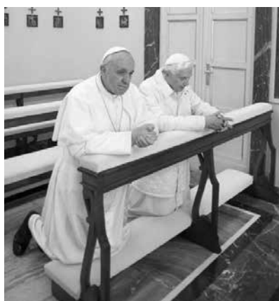
Castel Gandolfo, Palazzo Pontificio, 23 marzo 2013. Papa Francesco fa visita al Papa Emerito Benedetto XVI.

In particolare, la musica è stata per lui un’arte vicina con cui elevare lo spirito e l’interiorità. Ma ciò non gli faceva distogliere l’attenzione, da vero uomo di fede, alle grandi e spinose questioni del no-