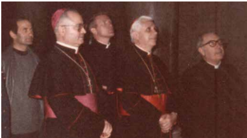
Troia, Basilica Cattedrale, 22 ottobre 1985. Il card. Joseph Ratzinger ammira il pulpito del 1169 e firma il registro delle presenze.

«Tentazione e grandezza della teologia. Permettete che concluda riportando una mia piccola esperienza, in cui questi problemi mi si sono resi direttamente percepibili. In occasione di una conferenza che dovevo tenere nell'Italia meridionale, mi è stato possibile visitare nello scorso autunno la