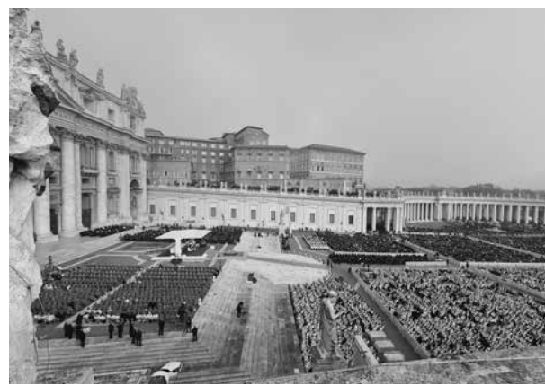
Vaticano, Piazza San Pietro, 5 gennaio 2023. I funerali di Papa Benedetto XVI.

ricordata, ponendo una domanda che fa eco a Fëdor Dostoevskij. E quando parla della Chiesa, la passione ecclesiale gli fa pronunciare parole quanto mai innervate di appartenenza e affezione: «Non siamo un centro di produzione, non siamo un’impresa finalizzata al profitto, siamo Chiesa».