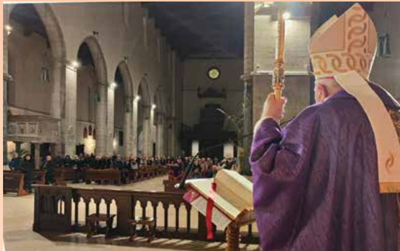
Lucera, Basilica Cattedrale, 17 dicembre 2022. La celebrazione di chiusura Anno formativo.

Sabato 17 dicembre, nei primi Vespri dell’ultima domenica di Avvento, con la Celebrazione Eucaristica presieduta da Sua Eccellenza mons. Giuseppe Giuliano presso la Cattedrale di Lucera, si è concluso l’anno di formazione per catechisti, operatori pastorali e liturgici, operatori Caritas e ministri straordinari della Comunione. Il corso, iniziato nel periodo d’Avvento del 2021, fortemente desiderato e voluto da mons. Vescovo, ha avuto come linea guida lo schema del Catechismo della Chiesa Cattolica. Esso si è, dunque, rivolto a tutti coloro che prestano servizio o che hanno chiesto di