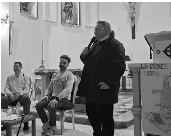
Alberona, Parrocchia Natività di Maria Vergine, 12 marzo 2026. L'evento.