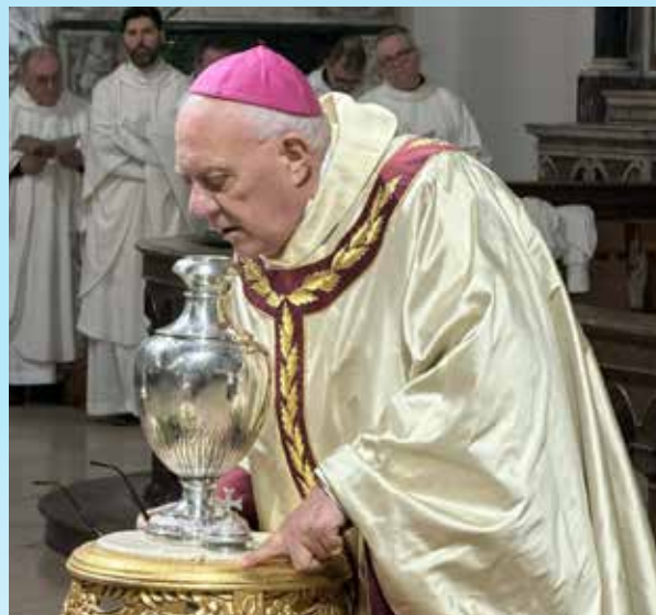
Lucera, Basilica Cattedrale, 1 aprile 2026. Mons. Vescovo benedice gli oli santi.

"Lo Spirito del Signore è sopra di me", ha citato il Presule, ricordando come l'unzione consacri