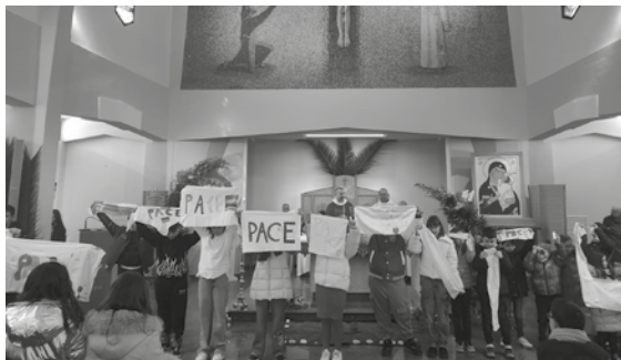
Lucera, Parrocchia San Pio X, 29 marzo 2026. La celebrazione.

Il 29 marzo scorso, la parrocchia di San Pio X ha vissuto una Domenica delle Palme dal respiro diverso, cucita interamente attorno a una parola semplice e potente: pace. Non solo un tema, ma un gesto condiviso, visibile, quasi tangibile lungo il percorso della processione parti-