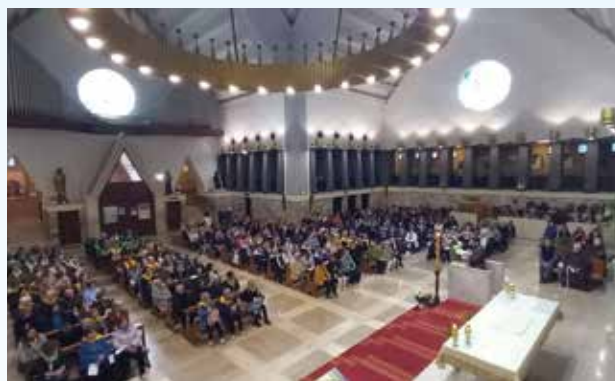
Incoronata (Foggia), Santuario dell'Incoronata, 13 aprile 2026. Il raduno.