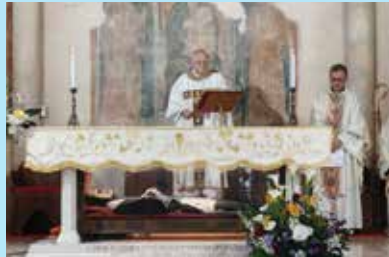
Lucera, Basilica San Francesco, 14 aprile 2026. La celebrazione presieduta da mons. Vescovo.