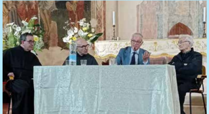
Lucera, Basilica San Francesco, 11 aprile 2026. La tavola rotonda.