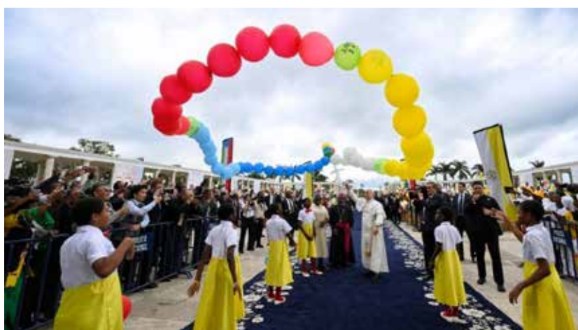
13-23 aprile 2026. Alcuni momenti del viaggio di papa Leone XIV in Africa.