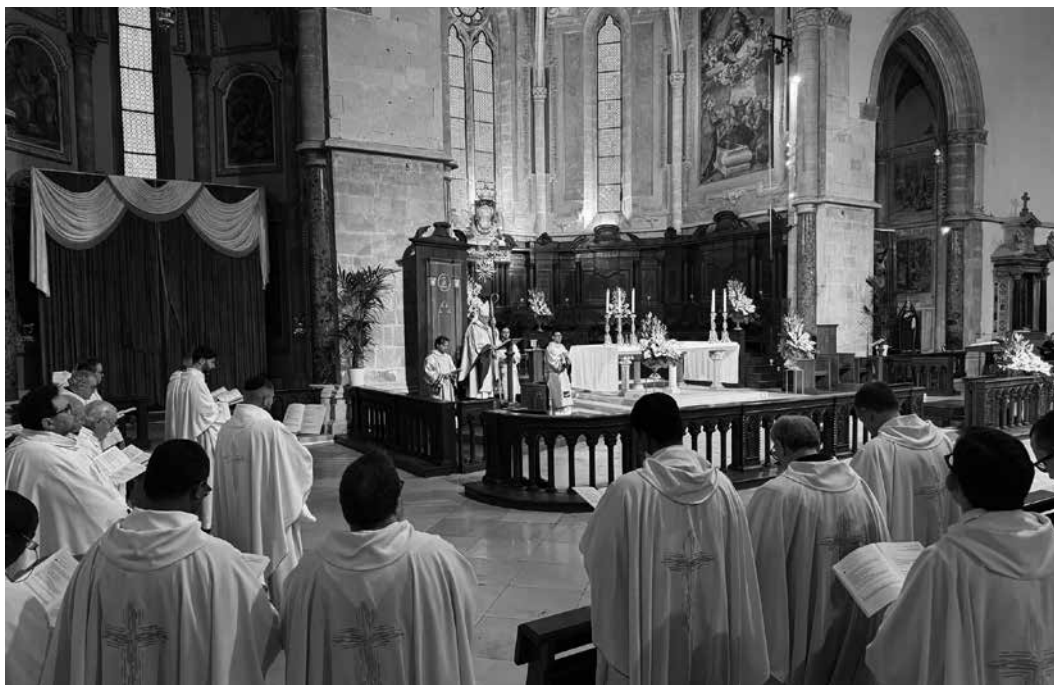
Lucera, Basilica Cattedrale, 1 aprile 2026. Durante la Messa crismale.

Vita e missione si richiamano a vicenda. In quanto la missione è segno di una Chiesa viva, fatta da gente viva che porta, discretamente e decisamente, il Vangelo nelle varie comunità e nei vari ambienti in cui si dipana l’esistenza degli uomini e delle donne, di oggi e di sempre.