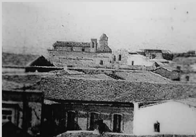
In lontananza, la primitiva chiesa di Cristo Re.

Terminati i lavori di adeguamento dell'aula liturgica fu eretto l'altare maggiore con una statua in cartapesta di Cristo Re, oggi alloggiata all'Ospedale Lastaria, opera del cartapestaio lucerino Raffaele Conte. Un secondo altare, sul lato sinistro della chiesa, venne dedicato a san Rocco con la statua della demolita omonima chiesa abbasce o'lammicche (in via san Rocco); sulla