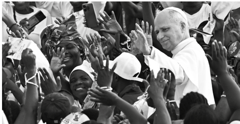
Papa Leone XIV in Africa.

Il terzo è la critica della tirannia e della corruzione, affrontate non come vizi individuali ma come patologie strutturali del potere. Il Papa ha mostrato come il dispo-