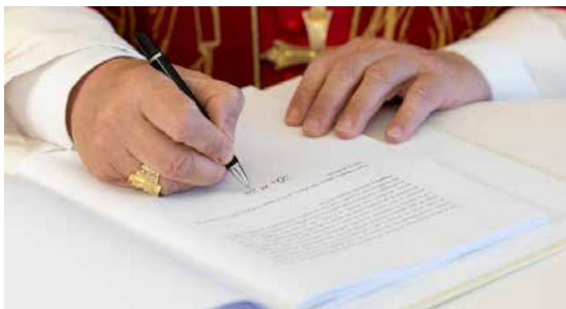
Papa Leone XIV (a sx) firma la sua prima enciclica (15 maggio 2026).

e capacità di intervento superiori a quelle di molti governi. Il potere tecnologico assume così un volto inedito, prevalentemente «privato», e per questo ancora più difficile da discernere, governare e orientare al bene comune». No, allora, ad «usi evidentemente antiumani» dell'Intelligenza Artificiale (IA): bisogna chiedersi «quale idea di persona e di società» ci sia dietro alle macchine. «Non serve un'IA più morale, se questa morale è decisa da pochi», l'appello di Leone, che denuncia soprattutto il potere di chi dispone già di risorse economiche, competenze e accesso ai dati. Di qui la «seria preoccupazione» per il fenomeno per cui «piccoli gruppi molto influenti possono orientare informazione e consumi, condizionare processi democratici e incidere sulle dinamiche economiche a proprio vantaggio, contraddicendo la giustizia sociale e la solidarietà tra i popoli».