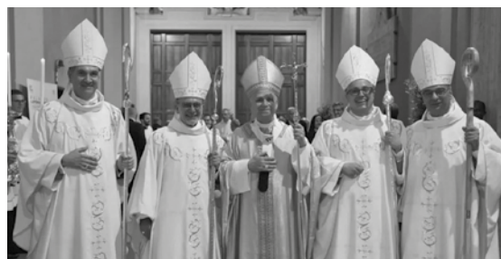
Roma, Basilica San Giovanni in Laterano, 2 maggio 2026. Papa Leone XIV con i nuovi quattro vescovi ordinati.

di strada ed avere nel cuore le periferie materiali ed esistenziali facendo in modo che nessuno debba pensarsi scartato da Dio. Li ha esortati ad essere testimoni di Cristo, che è venuto per servire e non per essere servito, invitandoli a motivare le persone e le comunità richiamando instancabil-