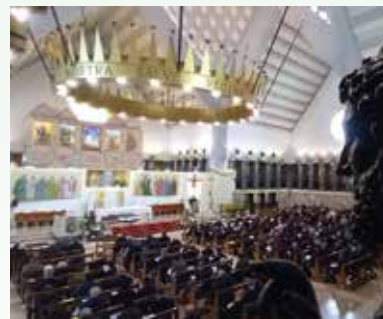
Foggia, Santuario dell'Incoronata, 15 maggio 2026. Il ritiro del clero di Metropolia.

tempo», guida di santi e riformatori della Chiesa. Da qui l'invito rivolto ai sacerdoti presenti a riscoprire la radicalità della propria chiamata. Nella sua relazione, il Cardinale ha insistito sul fatto che il ministero sacerdotale non possa es-