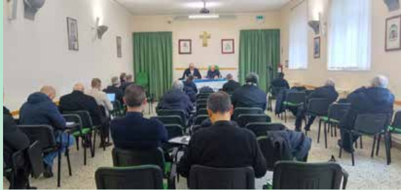
Lucera, Seminario diocesano, Auditorium. Durante un incontro di formazione.

Questo ciclo di incontri mensili ha mirato a riscoprire l'identità e la missione della Chiesa nel mondo contemporaneo attraverso una lettura guidata dei suoi capitoli fondamentali. L'itinerario formativo ha preso il via il 9 gennaio 2026, con una sessione guidata da mons. Vincenzo Francia. L'attenzione è stata posta sulla gerarchia ecclesiastica, analizzando nello