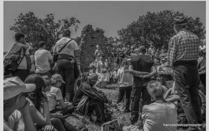
Un momento celebrativo del 16 maggio tra i ruderi della Cattedrale di Montecorvino.