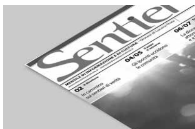
Nella solennità di Pentecoste, mons. Vescovo chiude il tempo di Pasqua.