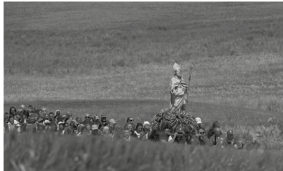
Agro di Pietramontecorvino, 17 maggio 2026. Il tradizionale pellegrinaggio.

Anche quest'anno si è celebrato, il 17 maggio scorso, il tradizionale pellegrinaggio in onore del santo Patrono Alberto, giunto alla sua 137ª edizione. Un appuntamento profondamente sentito da tutta la comunità, che rinnova ogni anno il proprio legame con la fede e