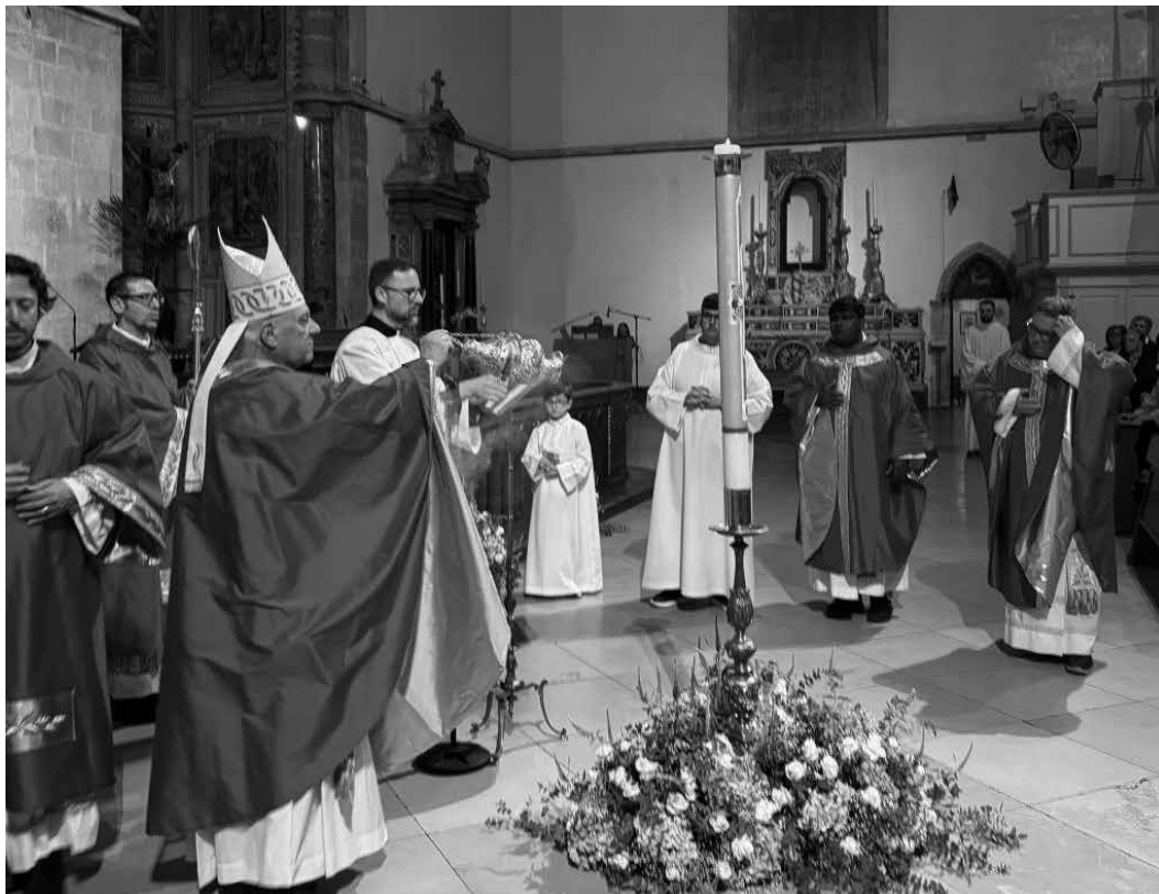
Lucera, Basilica Cattedrale, 24 maggio 2026.

Le nostre Comunità non sono come frastornate dalle parole degli innumerevoli “maestri del nulla” che non di rado soffocano la Parola che sola parla di vita, anzi che sola dona la vita significativa e piena?