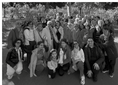
Roma, 2 maggio 2026. La comunità di Biccari saluta mons. Alessandro Zenobbi.

Il 25 febbraio scorso papa Leone XIV ha nominato quattro nuovi vescovi ausiliari per la diocesi di Roma, conferendo loro un titolo onorifico assegnando sedi titolari cioè sedi di diocesi soppresse senza giurisdizione pastorale: in particolare, a mons. Alessandro Zenobbi è stata assegnata la sede titolare di Biccari. Sabato 2 maggio, quindi, in un clima gioioso, la comunità biccariense guidata dal parroco, don Leonardo Catalano, accompagnata da altri due presbiteri e dalle autorità civili, si è recata a Roma per stringersi con la preghiera e con l'affetto intorno al nuovo vescovo titolare Alessandro nel giorno della sua ordinazione episcopale, che ha avuto luogo nella Basilica di San Giovanni in Laterano ed è stata presieduta dal Santo Padre Leone XIV. Durante l'omelia Sua Santità ha incoraggiato i vescovi ausiliari a raggiungere le "pietre scartate", ad essere pastori