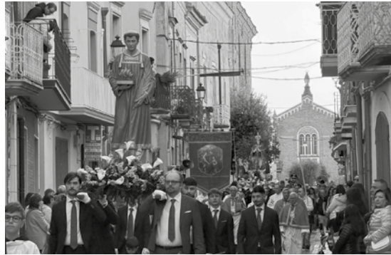
Troia, Via Regina Margherita, 26 aprile 2026. La processione.

Anche a Troia si sono svolti i tradizionali festeggiamenti in onore della Madonna Incoronata che si venera nella chiesa parrocchiale di San Vincenzo martire. Giorno 25, ultimo sabato di aprile, è stata celebrata una santa Messa all'aperto nella piazza antistante la chiesa, al termine della quale è stato acceso e benedetto il fuoco