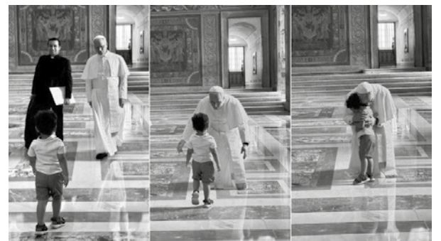
L’abbraccio di papa Leone XIV con un bambino che gli corre incontro.

dell’individualismo» ( DN , 17), dove le molte identità che abitiamo – professionali, sociali, digitali – trovano una possibile unità. E ancora, Francesco ricordava che «il cuore è il luogo della sincerità, dove non si può ingannare né dissimulare» ( DN , 5). Non perché sia spontaneo o immediato, ma perché è forse l’unico luogo in cui non si può mentire a se stessi.