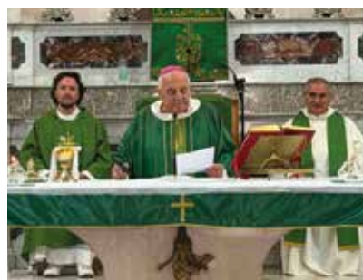
Celle di San Vito, Parrocchia Santa Caterina, 28 giugno 2026. Mons. Vescovo presiede l'Eucaristia.

Nel corso dell'omelia, mons. Giuliano ha invitato i fedeli a guardare al Vangelo come scuola dell'amore autentico. «Nel nome e nel cuore di Gesù – ha spiegato – si comprendono i legami più profondi tra genitori, figli e fratelli. È solo nell'amore di Cristo che impariamo davvero ad amare il prossimo e a ringraziare». Soffermandosi sul significato della croce, il Vescovo ha ricordato come essa, nella prospettiva evangelica, non rappresenti più uno strumento di morte e condanna, ma il segno della redenzione e della salvezza. «Parlare della croce – ha affermato – significa passare dall'illusione dell'egoismo alla