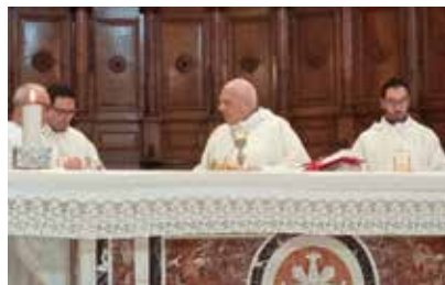
Biccari, Parrocchia Santa Maria Assunta, 7 giugno 2026. La celebrazione del Vescovo.

D omenica 7 giugno, nella solennità del Corpus Domini , Sua Eccellenza il Vescovo ha presieduto la santa Messa vespertina nella parrocchia Santa Maria Assunta in