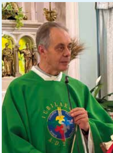
Troia, Parrocchia-Santuario Maria Santissima Mediatrix, 25 giugno 2026. L'immissione canonica del nuovo parroco.