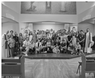
Lucera, Parrocchia San Pio X, 19 giugno 2026. Al termine della Messa.

Un ponte di fede, sacrificio e giovinezza unisce in questi giorni la Repubblica Ceca alla terra di Puglia. Cinquantuno studenti e quattro insegnanti del Liceo Arcivescovile